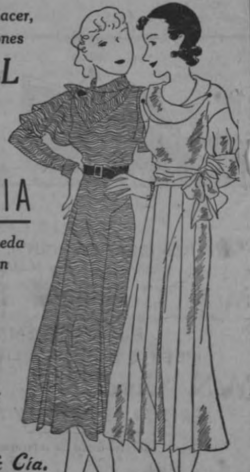
McCALL Printed Patterns left, 7141, Right, 7145