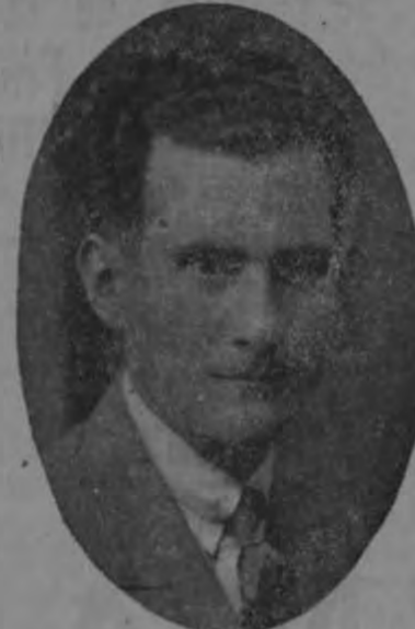
Don José Monge Dumani Diputado al Congreso Constitucional

Con justísima razón en el litoral hoy atribulado señor padre, dedicando sus energías al trabajo agrícola en fincas de Cartago y Turrialba, empuñándose siempre en fomentar prácticamente este trabajo en quienes le rodeaban.